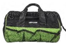
Сумка для хранения мойки и аксессуаров к ней